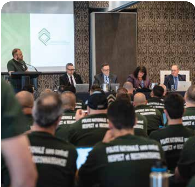
Le 26 mai dernier, l'APPQ a reçu la directrice générale et son état-major qui se sont adressés aux congressistes.