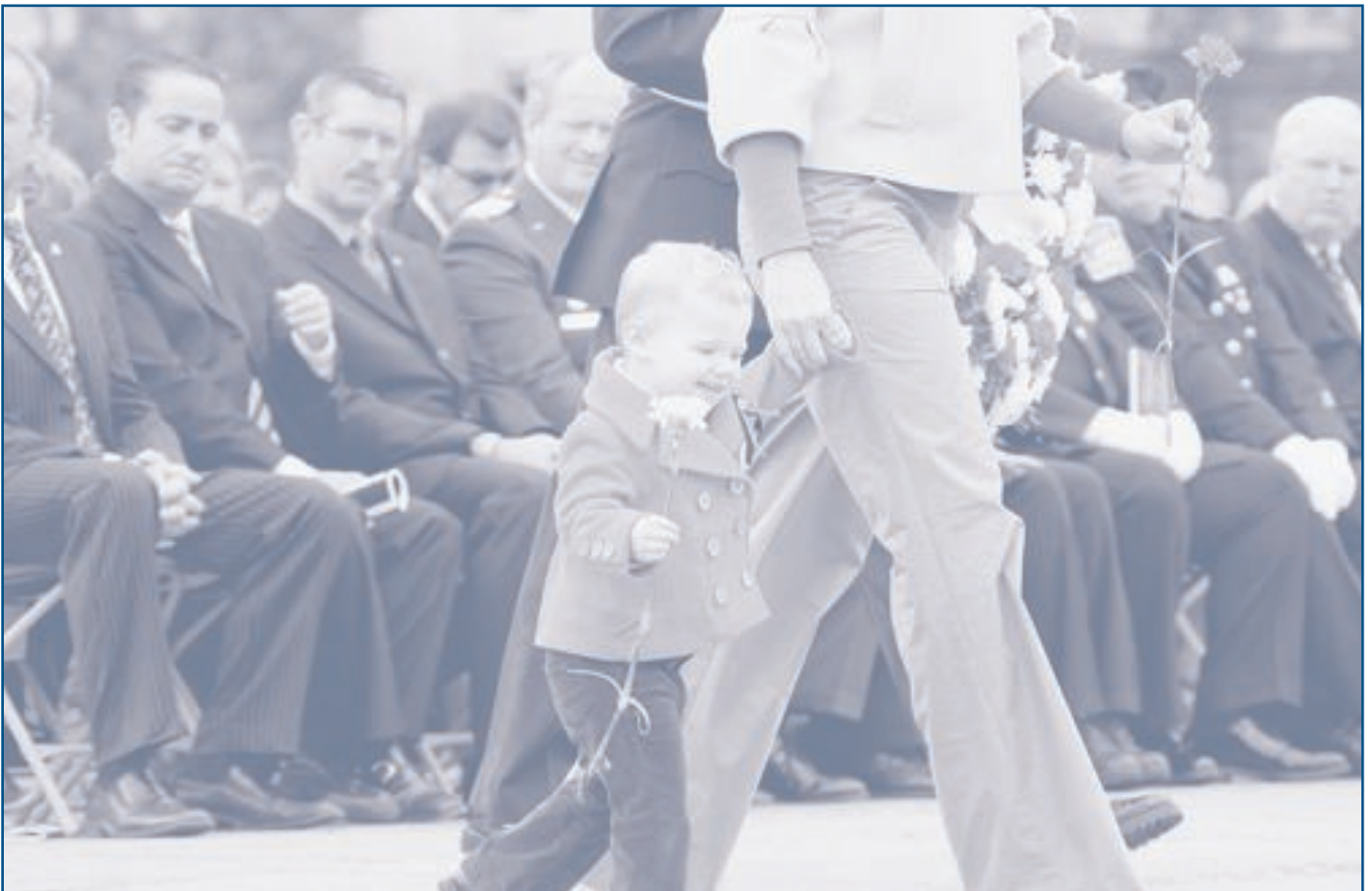
Une épouse et son enfant rendent hommage à leur héros.