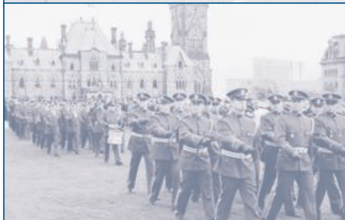
Contingent de la Sûreté du Québec