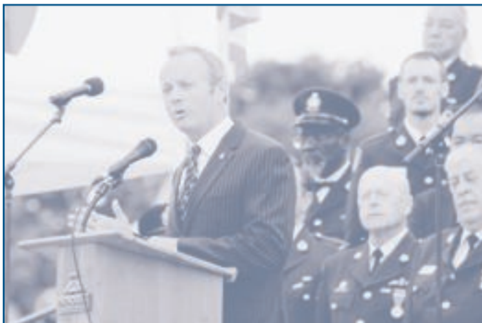
Le ministre fédéral de la Sécurité publique, M. Stockwell Day